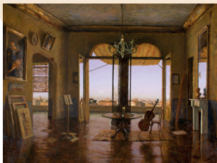
Le salon de musique 2019 Huile sur toile, 97 x 130 cm © ADAGP, Paris, 2024

Bienvenue dans l'univers mystérieux de l'exposition « Terra Incognita ». Dans ce lieu où des paysages oubliés prennent vie, nous vous invitons à une expérience sensorielle unique : une lecture musicale qui fusionne la poésie, la musique et la peinture. Aux rythmes des poèmes qui ont inspiré Pascal Vinardel, vous serez guidé dans les méandres