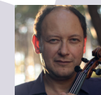
Vadim Tchidjick Violoncelliste