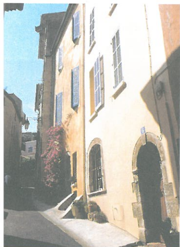
Rue Saint Paul